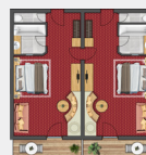
FAMILIENSUITE „TALLEIT“ | ca. 72 m 2 für 4 bis 6 Personen

Zwei in Altholz gehaltene Juniorsuiten mit Verbindungstür, je einem gemütlichen Wohnbereich mit zusätzlicher Sitzcke am Kachelofen, Ausziehcouch, zwei Badezimmern mit Badewanne und separatem WC, WLAN, Telefon, Radio, LCD-TV, Zimmersafe, Balkon.