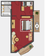
JUNIORSUITE PLUS „RAMOLKOGEL“ | ca. 51 m 2

In Altholz eingerichtete Suite mit separatem Einzelzimmer bzw. Kinderzimmer mit Etagenbett, gemütlichem Wohnbereich mit Schreibtisch, Ausziehcouch und Sitzcke mit Kachelofen, Badezimmer mit Badewanne, Doppelwaschbecken und separatem WC, WLAN, Telefon, Radio, LCD-TV, Zimmersafe, Balkon.