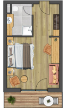
KOMFORTZIMMER „SPIEGELKOGEL“ | ca. 31 m 2

Geräumiges Doppelzimmer im alpinen Stil mit Holzboden, gemütlicher Couch, Badezimmer mit Dusche und WC, WLAN, Telefon, Radio, SAT-TV, Zimmersafe, Balkon.