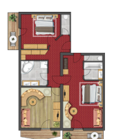
FAMILIENSUITE „SIMILAUN“ | ca. 96 m 2 für 4, bis 8 Personen

Suite „Similaun“ und Juniorsuite „Talleit“ mit zwei Schlafzimmern, eines davon mit begehbarem Kleiderschrank, das andere mit eigenem Wohnbereich mit Ausziehcouch, Sitzcke am Kachelofen und Badezimmer mit Badewanne und Sternenhimmel. Gemütliche Wohnstube mit Sitzcke am Kachelofen, Ausziehcouch, Schreibtisch. Zweites Badezimmer mit Infrarotdusche, Doppelwaschbecken und separatem WC, WLAN, Telefon, Radio, LCD-TV, Zimmersafe, Balkon.